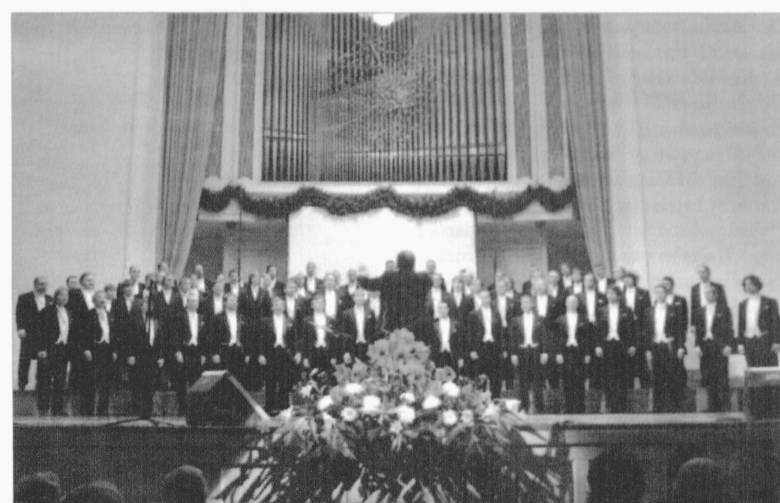
Tehnikaülikooli Akadeemilise Meeskoori 60. aastapäeva tähistamise põhirõhk langes detsembri keskpaigale, kui Tallinnas Estonia kontserdisaalis toimus kaks juubelikontserti ning Tallinna Tehnikaülikooli aulas korraldati 350 külalisega juubelibankett.