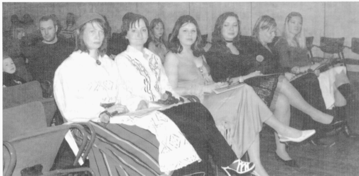
Tehnikaülikoolis toimusid 20. ja 21. detsembril traditsioonilised lõpuaktused. Talvisel sessioonil lõpetas kokku 411 tudengit, neist bakalaureuse- ja diplomioppe lõpetajaid oli 336, magistrikraadi sai 71 noort. Kiitusega diplomid - cum laude - said 14 tudengit.

Tallinna Tehnikaülikooli kiitusega lõpetanud detsembris 2005