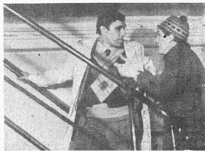
Момент съемок фильма «Моя дорогая».