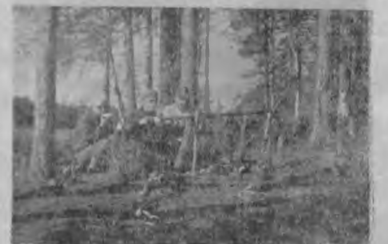
У костра. В походе на байдар как по Северной Карелии.

можно было встретить в Кавказских и Крымских горах и на дорогах республики, а водников — на порожистых реках Северной Карелии и на диких реках Прибалтики. Наши лыжники завоевали вершины Хибинских и Карпатских гор, велосипедисты ездили по бездорожью Карелии и по холмам западной и южной Эстонии. Туристы учебной группы КП-47 совершили 30-дневный 5913 километровый поход «автостопом» по маршруту Каунас—Сухуми—Каунас.