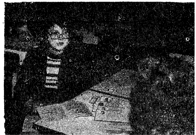
Еще один дополнительный вопрос...