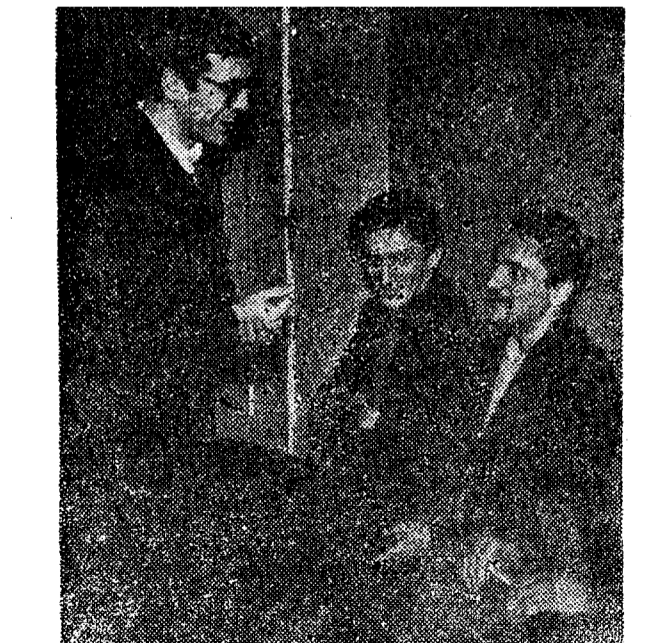
...А после сдачи поделитесь улыбкой