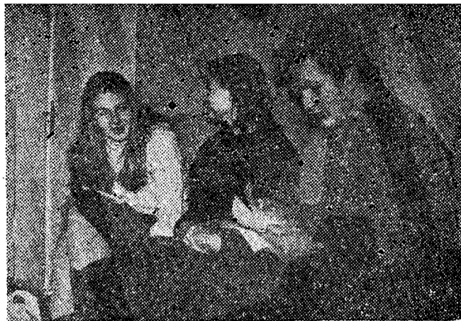
Близится и мой час...