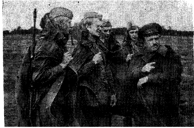
На снимке справа: занятия по военной топографии.