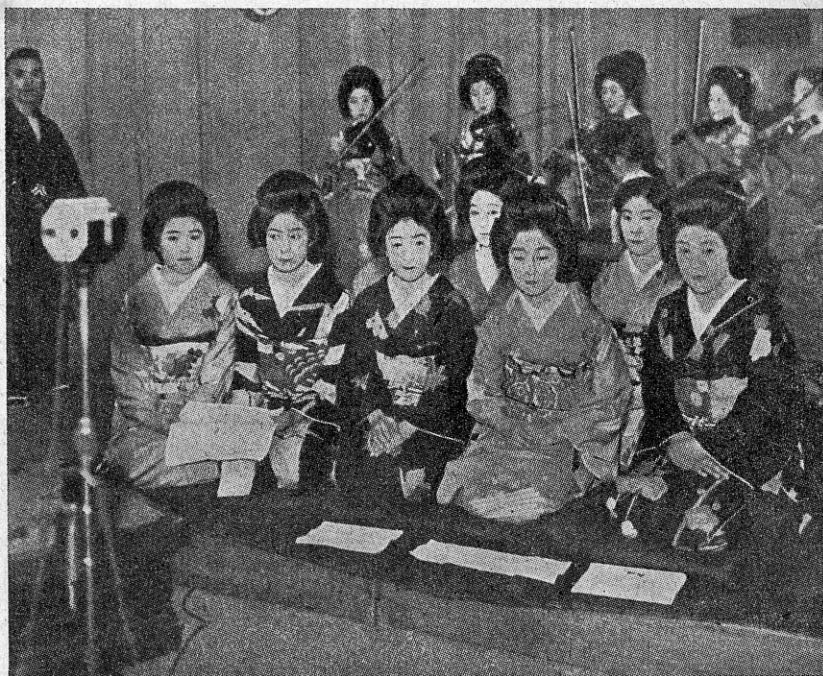
Geišade trupp mikrofoni ees moodsaid rahvalaule esitamas. Tagaplaanil olev saateorkester mängib euroopa instrumentidel, viiulitel.

Jaapani ja tema kultuuriga tutvumiseks pakuvad head võimalust tema lühilaine-saatjad, mis meilgi kuulda.