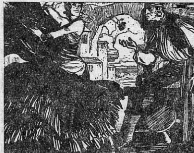
Stseen Bizet' „Carmenist“.