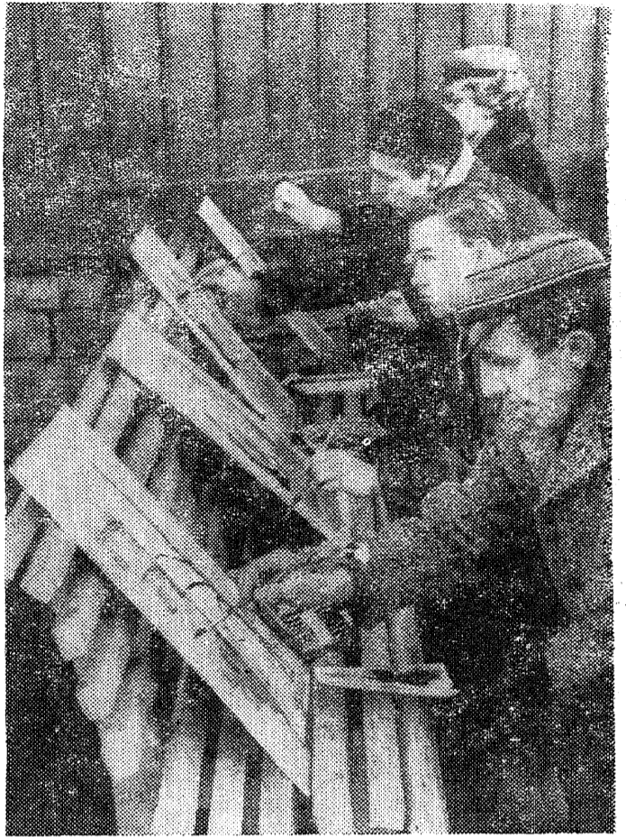
TERAV SILM JA TÄPNE KÄSI KULUB INSENE-RILE ÄRA KA SIIN. PILDIL: MEIE KUNSTIRINGI LIIKMED ON SEE-KORD TULNUD HARJUMÄELE, ET KIEK IN DE KÖK'I AKVARELLIS JÄÄDVUSTADA.