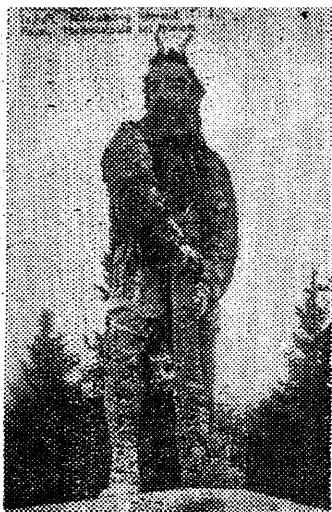
Kalevipoja kuju, mis asus Glehni pargis.