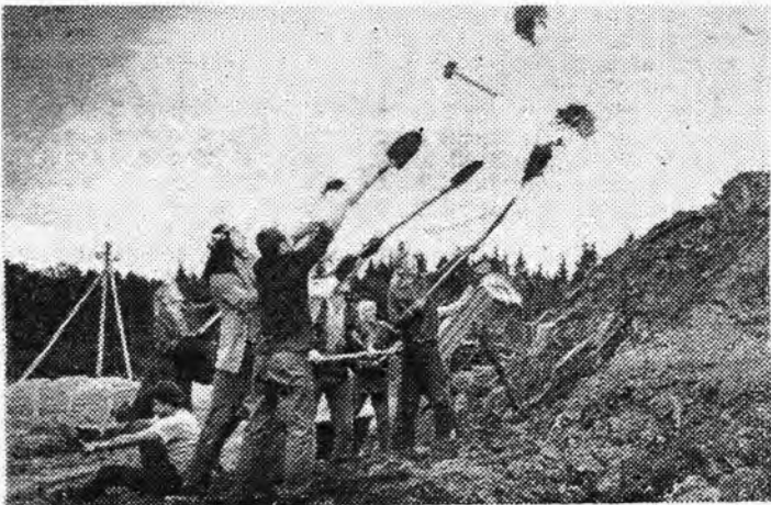
△ Töö lausa lendab malevlaste tugevais käsis.

Kurvastusega nenditakse, et malev on ainus üliõpilaseorganisaatsioon, mis ühendab meie vabariigi tudengid. Samuti on malev jäänud ainsaks tegeliku omavalitsuse realiseerimise kohaks. EÜE on praegu organiseeritum üliõpilasiikumise vorm. Igal liikumisel on ka omad juhid, antud juhul kesksstaabi me-