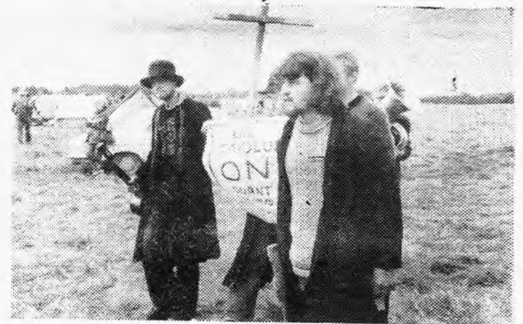
△ Nii maeti maleva taidlust.

Et rühmapäevikut korras hoida, peavad tähtsajad raamatupidamisalased teadmised. Näiteks kui komandör oleks teise kursuse mehhanikaüliõpilane ja esimest aastat funktsionäär, siis ta lihtsalt ei saa päevikuga hakkama. Peab sisse seadma veel ühe funktsionääri staatus, rühma raamatupidaja. Ja tööd jätkuks tal iga õhtul küllaga. Ainus korrasolev rühmapäevik oli Aruküla rühmal, kus komandör juhtus olema raamatupidamise erialal. Seega komandör-raamatupidaja. Kas nii, et kui päevik ja paberid kaenlas, oled hea mees? Aga ära saadki kannatada paber kõlke ja lausahtlud kannatavad jälle pabereid. Igal aastal tuleb neid juurde. Staabid peaksid esimese löögi enda