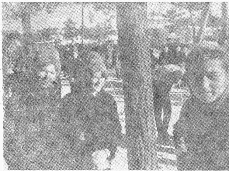
Juba kevadiselt soe päike ja Keila suusamaraton meelitasid eelmisel pühapäeval Nõmmele suure hulga rahvast. Pildil: Esiplaanil rühm esimese kursuse tütarlapsi tuli ergutama oma sõpru — suusamaratonist osavõtjaid.

Eesti NSV Ministrite Nõukogu Riikliku Kõrgema ja Keskerihariduse Komitee peainspektor