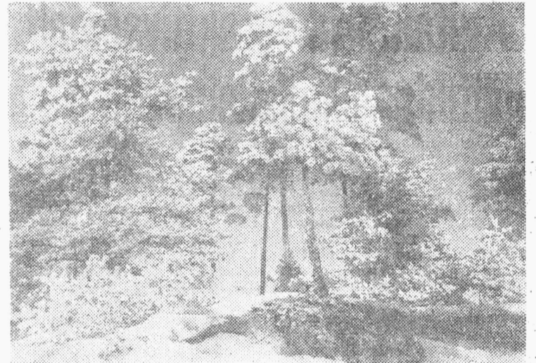
Peeter Tobberi fotoetüüd