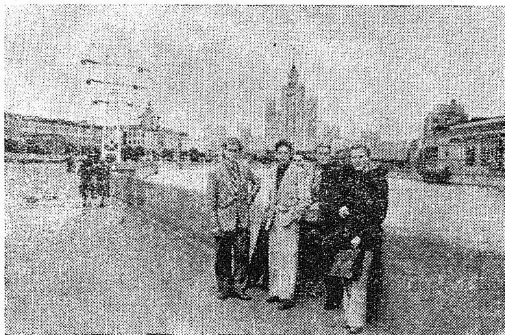
Õpperühma O-71 üliõpilased, kes viibisid möödunud suvel tööstuspraktikas Donetsi basseinis tutvusid läbisõidul meie maa pealinna vaatamisväärsustega.

Sellega ei tohi aga edaspidi enam leppida. Meie kõigi kohuseks on mitte ainult hästi õppida, vaid ka saavutada edu teistel aladel — lühidalt hästi töötada.