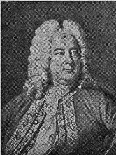
Georg Friedrich Händel

Suure nädala saatekavade põhivara moodustavad kogu Euroopa ringhäälingus J. S. Bach'i ja G. F. Händeli teosed ning R. Wagneri müstilis-religiöösne ooper „Parsifal“. Eesti ringhäälingu saatekavasse on tänavu võetud katkendeid „Parsifal“, Händeli oratooriumi „Messias“ III osa ning Bach'i ja Händeli väiksemaid töid.