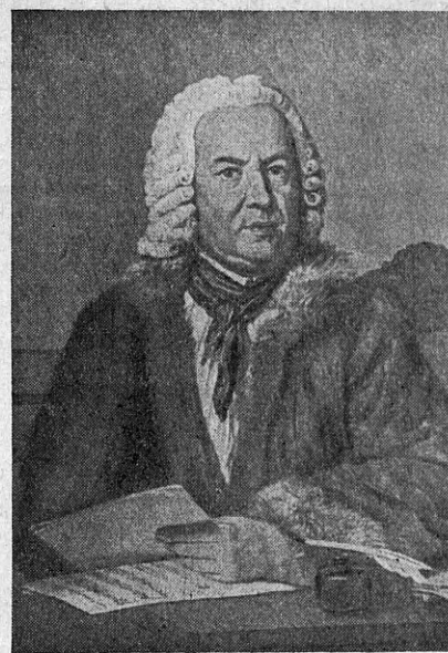
Johann Sebastian Bach.

Johann Sebastian Bach sündis Händelist vaevalt kuu aega hiljem, 21. märtsil 1685 Eisenachis, jäi varakult vaeslapseks, kasvas oma venna hoole all ja saadeti siis Lüneburgi Michaelise-kooli, kust ta võis käia kuulamas Hamburgi kuulsaid organiste. 1703 sai ta violinistiks Weimaris, siis organistiks Arnstadtis. Sealt külastas ta Lübeckit, et seal kuulata kuulsat heliloojat ja organisti Buxtehudet. 1707 sai ta organistiks Mühlhausenis, kus ta abiellus, 1708 õueorganistiks ja kammermuusikuks ning 1714 õuekontsertmeistriks Weimaris. 1717 läks ta Coethenisse Anhalti vürsti Leopoldi kapellmeistriks ja 1723 Leipzigi,