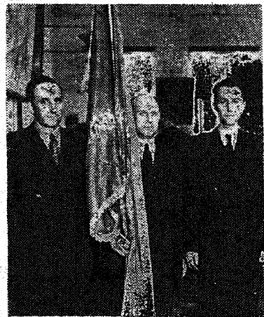
Горно-химическому ф-ту за хорошую методическую и научно-исследовательскую работу присуждено переходящее Красное знамя.

в течение 10—15 минут, политинформатор контролировал выполнение отстающими студентами взятых ими обязательств по ликвидации задолженности.