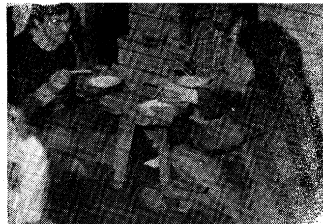
... и свободное время

На этом семинаре комсорги прослушали лекции и сообщения о жизни общественных организаций института, проводили организационную игру. Сейчас во многих солидных ведомств проводятся такие «игры». С их помощью учатся новым формам и методам руководства. Стоит отметить, что на семинаре тема игры была выбрана в соответствии с его задачами: проведение комсомольских собраний в группах. Надо сказать, что игра неслась в себе большой запас практических знаний и навыков комсомольской работы. Собрания вели члены комсомольского бюро механического факультета, повестка дня была сложной. «Члены группы» — комсорги первых курсов — настолько активно включились в игру, что прения затяннулись, и собрания в регламент не уложились. В результате проведения собрания выяснилось, как важна сплоченность группы для решения многих вопросов, выявилась роль комсорга группы. В группе есть еще староста, профорг — наглядно выявилась необходимость всей тройке координировать свою работу, всегда поддерживать контакт с деканатом и профсоюзной организацией, уметь защищать интересы группы.