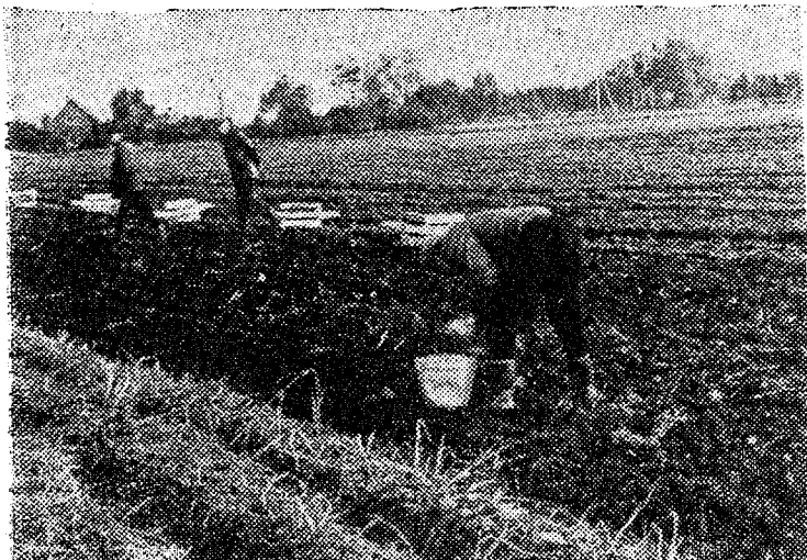
Вот так в этом году убирают урожай картофеля.

В колхозе «Халинга» Пярнуского района главный агроном