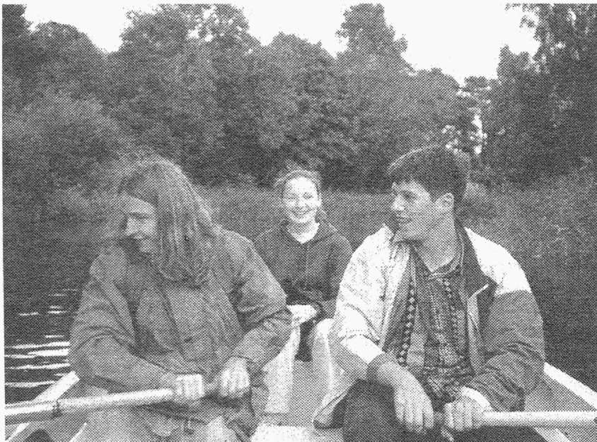
Suvi IAESTE moodi