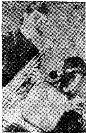
◆ Muusikakooli dixieland.

Põllumajandustudengid alustasid rebasealuludega. Lavaval mehhaniseerimise I kursuse tunkedes poisid, neli kitarr. Kava meenutas biitleid