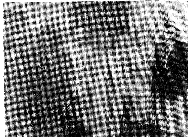
TPI naisvõimlejad Kiievi Riikliku Ülikooli ees.

Очень слабо выступали на спартакиаде наши велосипедисты, которые впервые выступали в подобных соревнованиях. Только один студент Верги из