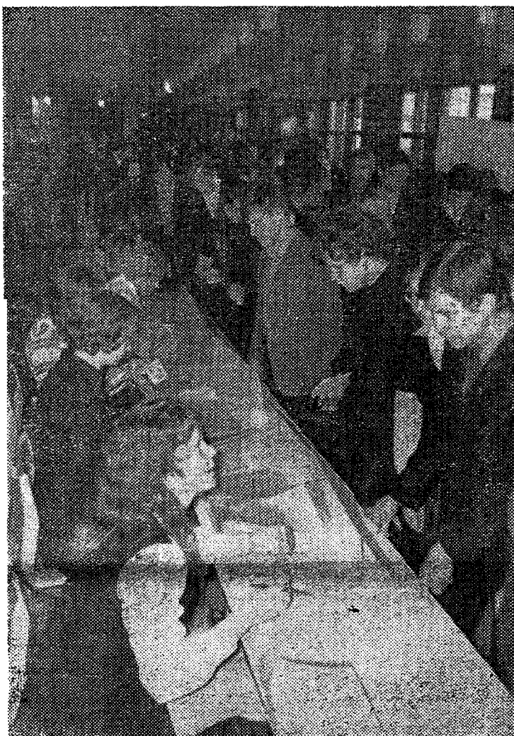
● Instituudi fuajees enne komsomolikonverentsi algust

Mõningast edu on saavutatud loengulise töö organiseerimisel. Ideoloogiasektori tööle hinnangu andmisel tuleb puudusena esile tuua ta vähest koordineerivat osa erinevate tööloikude vahel. Ideoloogilise töö puudujää-