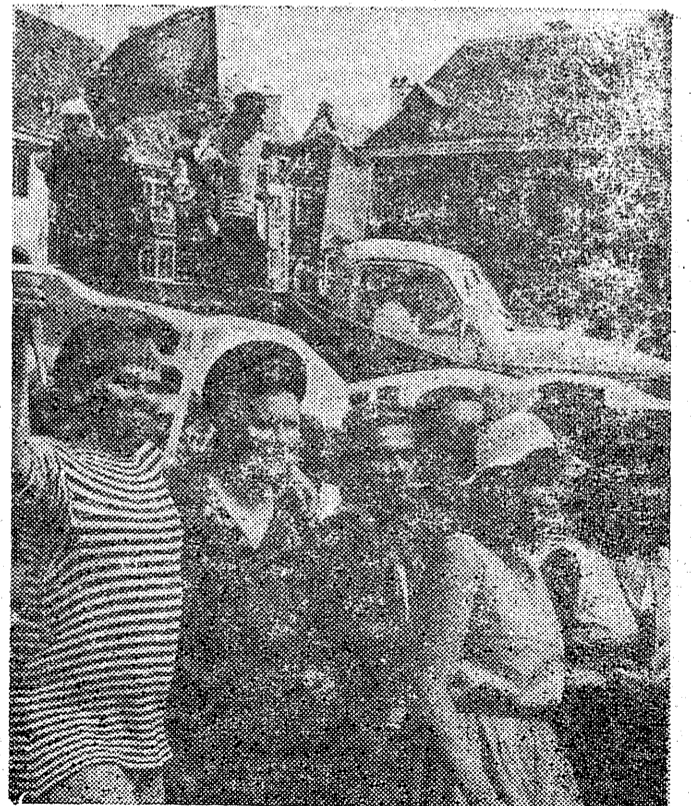
Nimoodi — revolutsiooniliselt ja uljalt malevasuvi Raekoja platsil juulikuus 1989, algas möödunud