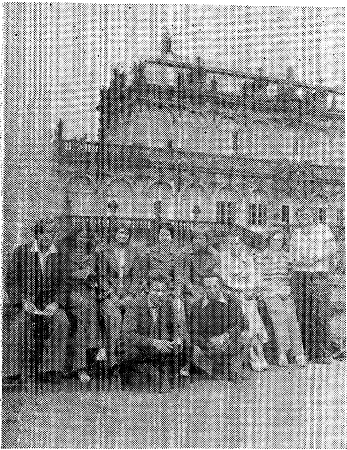
Dresden. Zwingeri lossi õues.