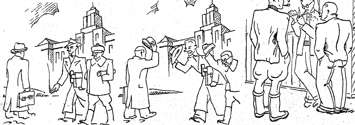
Kogu semestri päält.