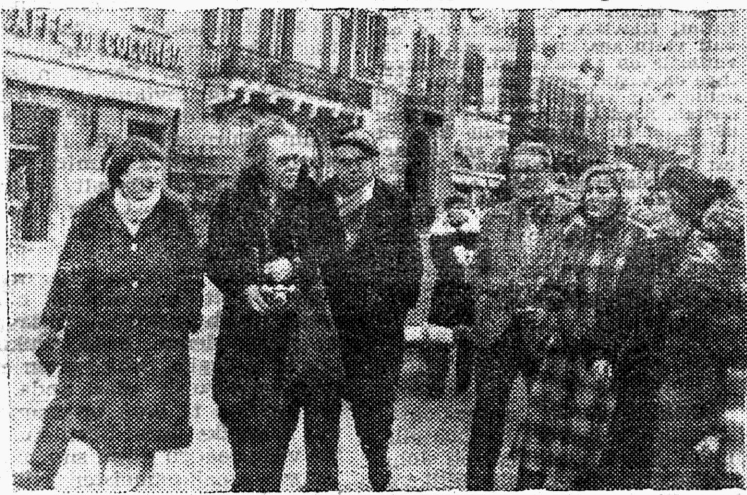
* Meie koos giidiga Rooma tänaval.

Nagu heas romaanis, läks ka meie reis tõusva pingega. 11. jaanuaril saabusime kunstikogude ja arhitektuurinälestuste poolest rikkasse Dante Alighieri sünnilinna Firenze.