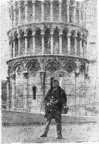
* Kuidas Pisa torni loodi saada? Asetada maa ja fotograaf kaldu!

Torinost väljusime 7° külma ja lumesajuga. Ootas ees sõit Loode-Itaalia ja Sveitsi merevärvasse, vanasse ja ka praegu tähtsasse sadamalinna Genuasse. Eeskujulik autostraad (kõikide suurte autoteede ehitus on nõudnud miljoneid liire, seetõttu on nad küll väga heas korras ja liiklusohutuse