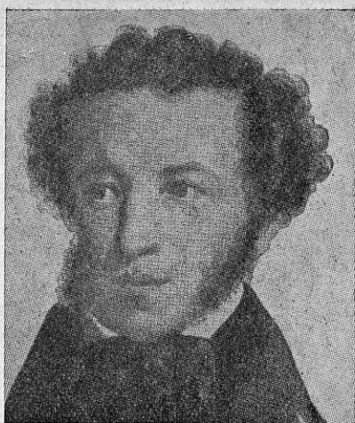
Aleksander S. Puškin