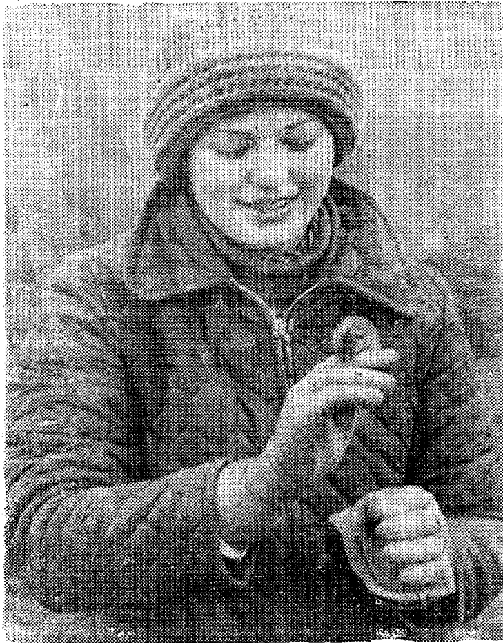
Igasuguseid põllupilte, küll kastide, ämbrite ja traktoritega, küll tööhoogsete kartuli- ja porgandivõtjatega oleme sel sügisel avaldanud enam kui üks korra. Olgu seekordne (ilmselt viimane) sügisemeenutus teiselaadne: tõestus selle kohta, et mitte kõik tüdrukud ei karda hiiri.

Partei agrarpoliitikas on tähtis osa kapitaalehitusel. Nagu märgitakse NLKP KK 1978. a. juulipleenumi otsustes, tuleb kapitaalehitust maal tunduvalt hoogsamini arendada. Pleenumil seati ka kõrgkoolidele konkreetseid ülesanded, mis vajavad tähtmist. Vabariigi põllumajandusehitusega tegelevate projekteerimis- ja ehitus-montaažorganisatsioonidel on ammused tihedad sidemed TPI ja selle ehitusteaduskonnaga. Juulipleenumi materjalides on palju tähelepanu pööratud suur-