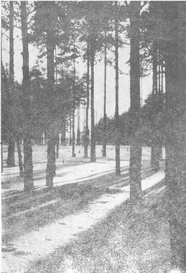
Päike on juba sulatanud puude't lumekatte.