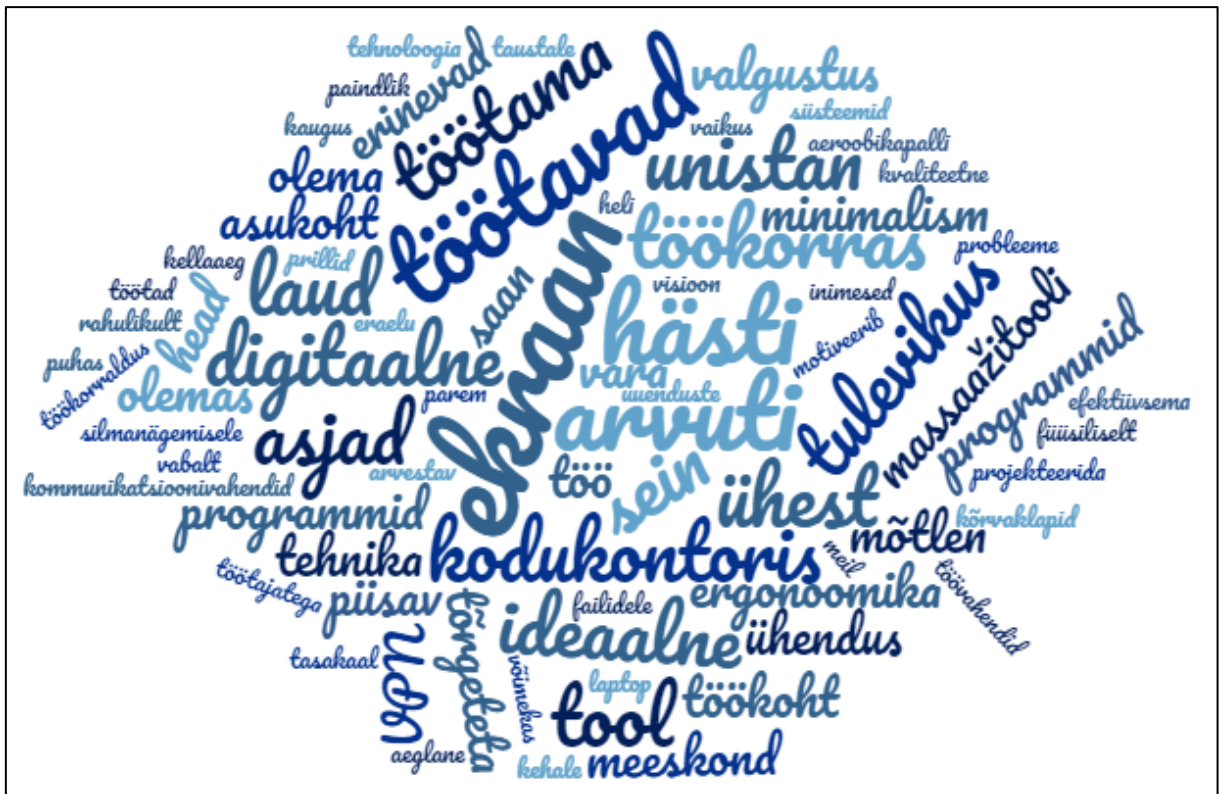
Joonis 3. Sõnapilv ideaalse digitaalse töökoha kohta

Lõpetuseks paluti kõikidel vastajatel tuua välja mõni mõte, mis neil vestlusest kõlama jäi. Osaleja 4 märkis, et „digitaliseerimine tähendab inimeste jaoks väga erinevaid vaatenurki“. See tähendab, et sellega võivad kaasneda väga erinevad probleemid. Seetõttu on oluline seda erinevust mees pidada ja sellega arvestada. Mitmed intervjuueeritavad mainisid, et vestlusest jäi kõlama toetusgrupi olulisus, kelle käest vajadusel abi küsida. Õnneks taolisi inimesi ka on. Väga oluline on pöörduda mõne kolleegi pole, sest kindlasti leidub keegi, kes oskab ise aidata või edasi suunata, kui ta ise ei oska lahendust välja pakkuda.