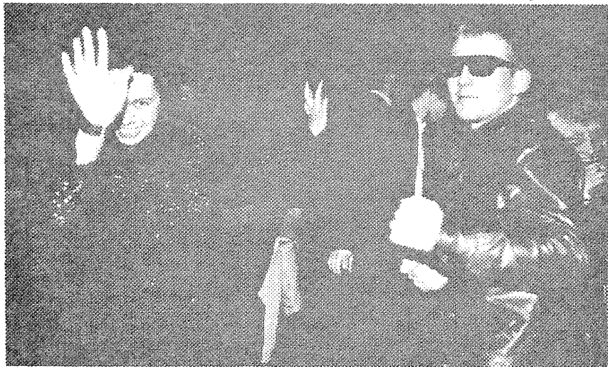
Pildil: 70 ndate aastate pidu Glehni lossis

Talv on taevast maha tulnud, igasuguseid põidlapikkusi mehikese on ammu hulganisti ringi sagimas, tänavatel hiilib ringi õnnistatud ilmega inimesi.