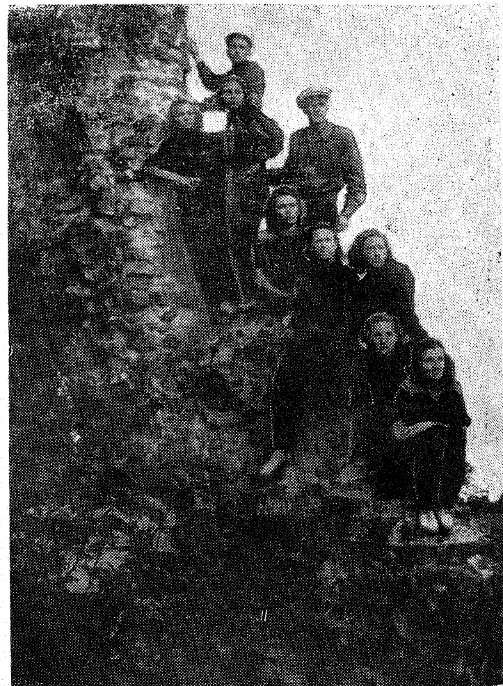
Õpperühma T-II matkagrupi liikmeid.