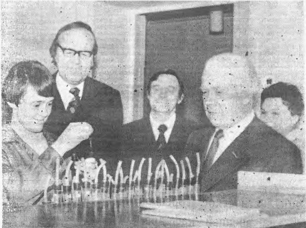
Первый секретарь ЦК КПЭ К. Вайно среди преподавателей и студентов в лаборатории неорганической химии.

Тепло встреченный собравшимися выступил К. ВАЙНО. Он сердечно поблагодарил избирателей за высокое доверие и заверил коллектив института, что не пожалеет сил, чтобы его оправдать, будет верно служить народу, делу построения коммунизма.