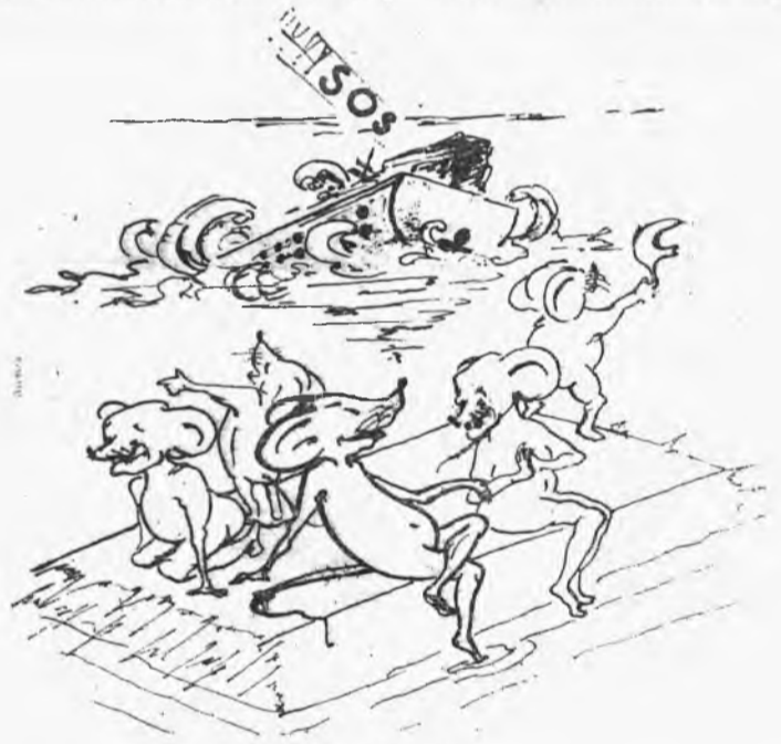
— А ведь мы их предупреждали!..