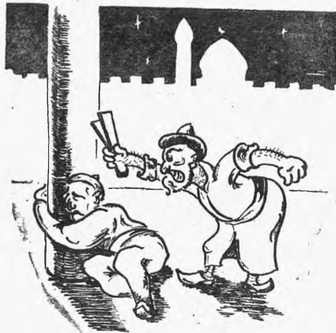
ВАРИАЦИИ НА ТЕМУ «1001 НОЧЬ». — Спите спокойно, жители Багдада!..