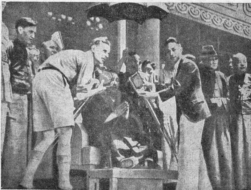
Pantschen Lama, üks elavaid Buddasid, õnnistab kogu maailma buddiste. Mikrofone hoiavad üks hiina ja üks ameerika ringhäälingu-reporter.

Huvi ringhäälingu vastu tuleb Hiinas veel äratada. Elanikkond on vaene ja jaksab vaevalt aparate osta; seepärast on sisemaal valjuhääldajad asetatud peamiselt raudteejaamadesse, mis idamaal on kõikjal armastatud kogumiskohtadeks, ja asendavad seal üksikvastuvõtjaid. Hiina erasaatjad — neid on umbes 20—30 — levitavad peale päevauudiste ja hiina muusika rohkesti sõnalisi ettekandeid, mis koosnevad peamiselt muinaslugudest ja -juttudest. Rohkesti ruumi antakse ka teatritükkidele, kas stuudiost või ülekannetena, mis sagedasti kestavad mitu tundi. Vahepeal levitatakse valitsuse ja politsei teadaandeid ning aegajalt tunnike euroopa muusikat. Vastuvõttu raskendavad tundu-