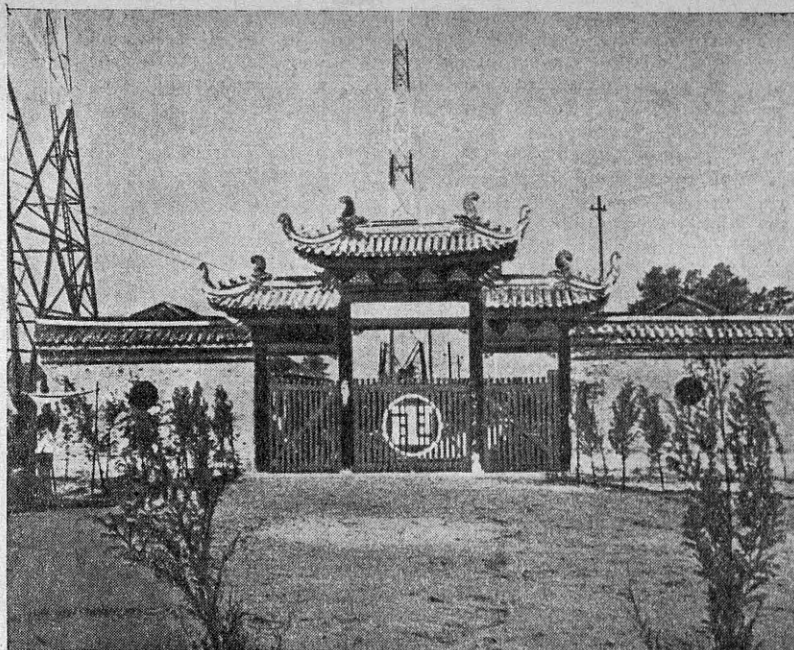
Uus ringhäälingusaatja Chengtus, Hiina läänepoolseima provintsi Szechwani pealinnas. See on ainuke ringhäälingusaatja Hiina selles osas.

Ringhäälingu kasutajad, kes omavad ringhäälingu kasutamisoa, aga pole tasunud kasutamismaksu kalendripoolaasta esimese kuu jooksul, loetakse maksuvõlglasteks-abonentideks. Neilt nõutakse maksuvõlg sisse administratiivkorras ühes ühe kroonise lisamaksuga.