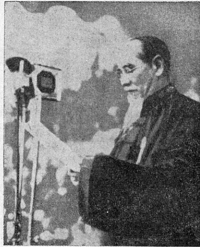
Hiina vabariigi president Lin Sen rahvuspuha puhul ringhäälingus kõnelemas.

Üks 1931. a. koostatud viisaastakukava ringhäälingu alal oli põhimõtte-