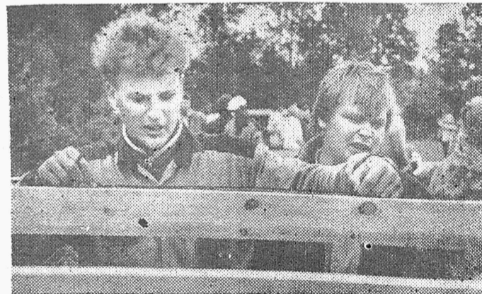
● Töö on malevlase tõsine mäng.

Muutust oli tunda regioonide omavahelistes suhetes. Üldmulje jäi sõbralikum ja terviklikum, regioonide suur sõprus hõisati lavalt lausa kõva häälega maha, ehk liigagi deklaratiivselt. EÜE '87 äärmist kokkukuuluvustunnet märkas ainsast pilgust laagripaigale, kus kõik sõbralikult koos stiilis: sinu jalad