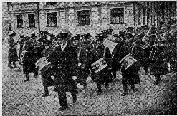
Tallinna garnisoni orkester Toompea lossi ees vahtkonna vahetusel tulles.

Väiksemad riigid ei ole nii rikkad, et endale muretseda häid ja kalleid pille ja seepärast ei või nemad mängukvaliteedilt saavutada seda taset, mis suuremad riigid nagu Inglise ja Itaalia. Ka meie kuulume nende hulka, kes ei või endale lubada väga heakvaliteediliste pillide muretsemise luksust. Kord ühe suurema ja vana Saksa puhkpillivabriku esindaja, vaadeldes meie kaitseväe orkestri pille, nimetanud neid külamuusikuile kõlvulisteks. Meil on ainult üksikuid isikuid, kes võivad uhkusega omaks nimetada paremaid pille. Kaitseväe