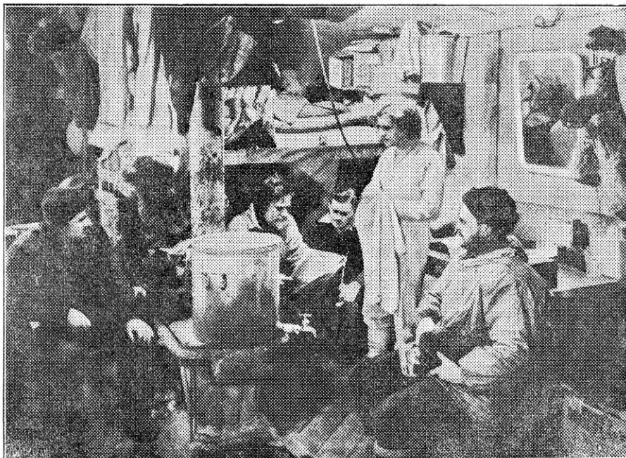
Mugav tuba jääkörves.