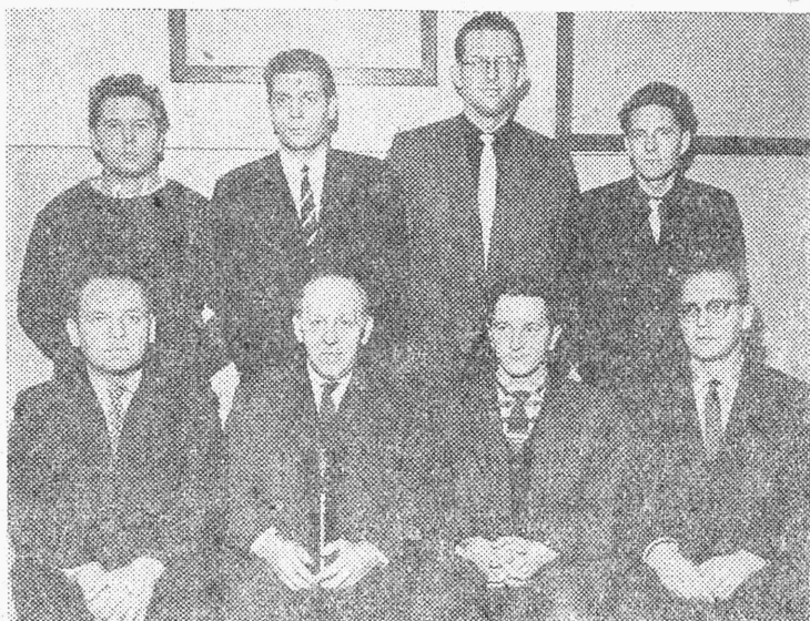
kond, meeskondadest ehituskonstruksioonide kateedri sportlased. Fotodel te näetegi esimese spartakiaadi võitjaid.