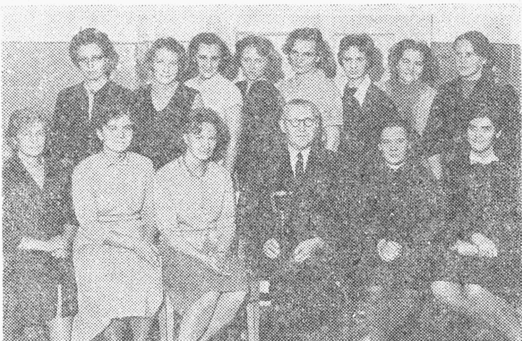
1963. a. lõppes TPI õppejõudude-teenistujate I komplekspartakiaad. Naiste osas tuli võitjaks orgaanilise keemia kateedri võist-