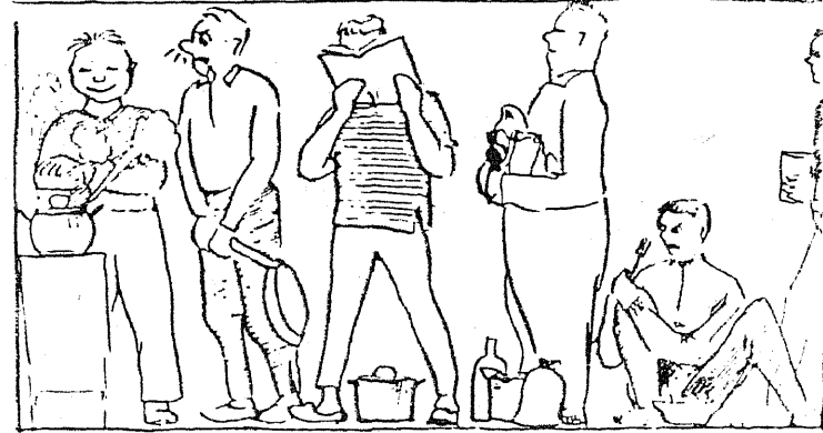
Nii on Rahvakohtu tänava ühiselamu köögis.

poissi, köök vingu ja sinist suitsu täis. Päeval käisin loengutel, peale lõunat õppisin ja õhtuti tahtsin kultuuriselt vaba aega veeta. Pika järelepärimise peale sain teada, et alumisel korrusel on meil vaba aja veetmiseks ette nähtud selline koht, mida nimetatakse punanurgaks. Lüksis rõõmsal meelel alla. Isolaatori vahetus läheduses oli üks lukustatud uks. Et teised ukse avanesid kas kööki, pesuruumi või treppikotta tulin järeldusele (mis