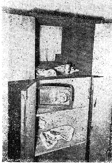
See on televiisorikapp.

Siis kuulsin korra koridoris, kuidas üks Lenini puieestel elunev ehitaja pajatas, et mullu käinud neil igal õhtul ping-pongi lahingud. Ei pidanud pikka