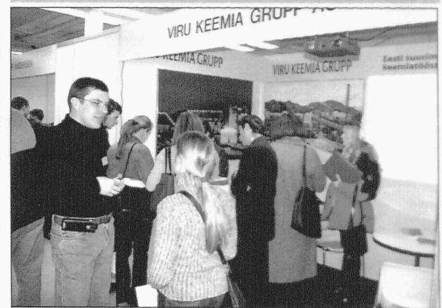
Viru Keemia Grupp AS käis messil keemiainsenere otsimas.