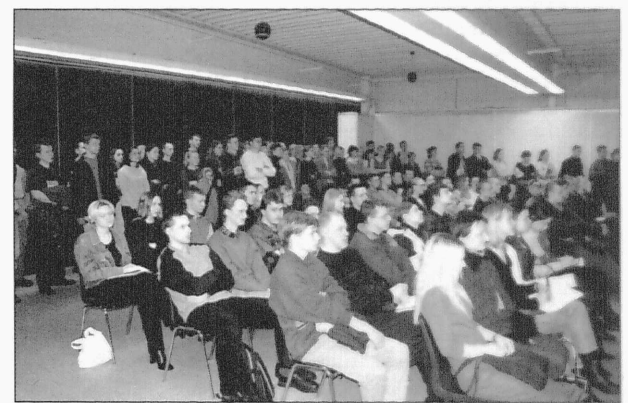
Tudengid kuulamas CV-Online'i loengut "Praktikant=tapeet tööandja seinal?"