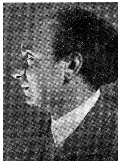
Youssef Greiss, egiptuse helilooja.

Praegu töötavad Egiptuses järgmised saatjad: