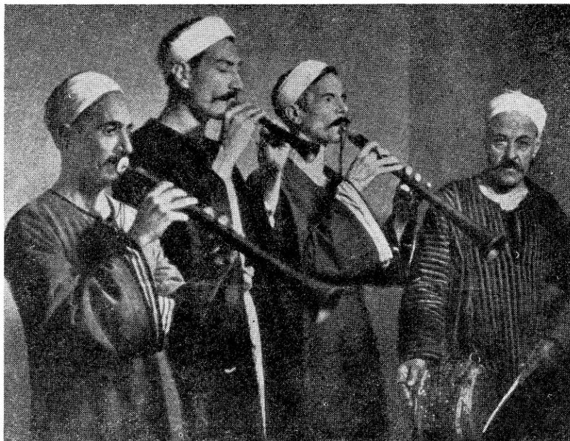
„Mizmar Baladi“, armastatuim araabia kvartett Egiptuse ringhäälingus.

Egiptuse elanike arv on viimaste andmete järgi 16 miljonit. Registreeritud ringhäälingu kuulajaid on