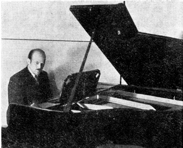
Medhat Assam, egiptuse helilooja ja pianist. orkestrijuht Egiptuse ringhäälingus.