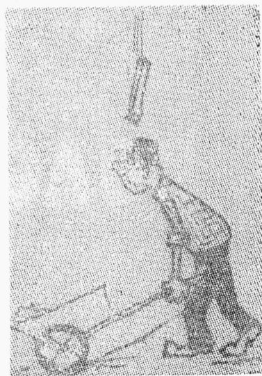
В третьем семестре.

Следующий номер «Таллинского политехника» на русском языке выйдет 16 октября.