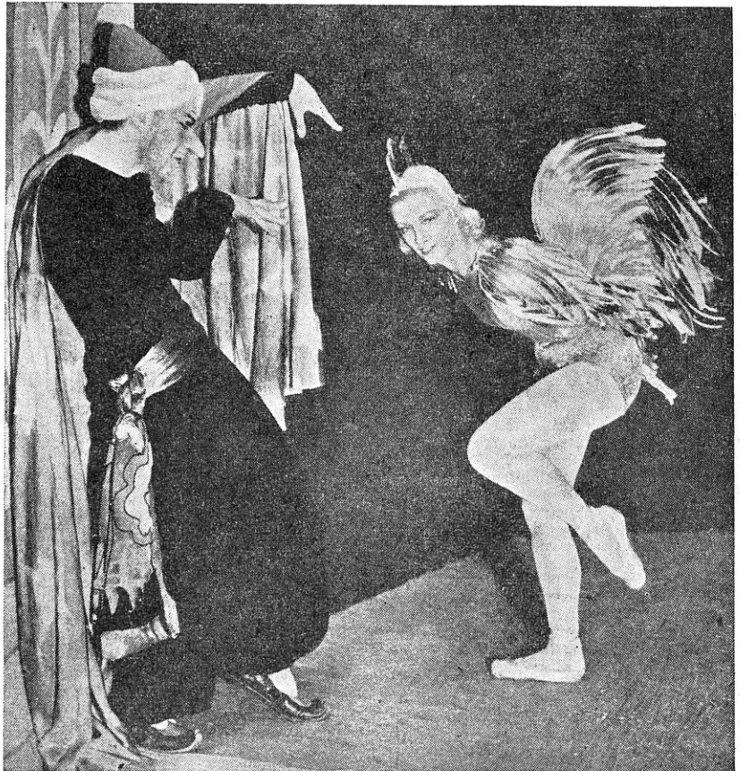
„Kuldkuukeke“ on ühe kütkestava Rimski-Korsakovi muinasjutulise balleti nimi, mille sündmustik, samuti nagu „Scheherezade“ oma, rullub Idamaal.