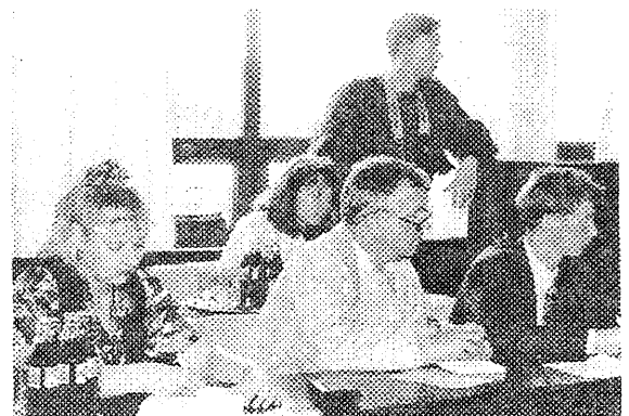
Eesti press esindajad salvestasid kuuldu hoolega