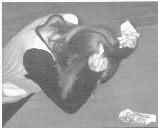
MURE: Majanduslikud raskused mõjuvad esmajoonel õppeedukusele.

Seda näitab ju seegi, et ametlikult maksaks Tallinna Linnavalitsus toimetulekutoetust vaid neile tudengitele, kes on sündinud ja kasvanud Tallinnas ning õpivad Tallinna ülikoolides. Huvitav, kui suur