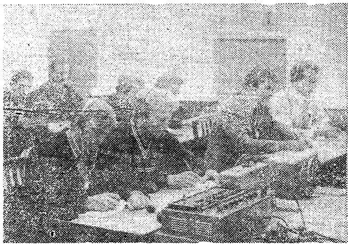
254-й учебный взвод на занятиях.

Нередко студенты, приступая к изучению новой дисциплины, не вполне представляют себе ее специфические особенности, не знают основных «точек приложения сил» для успешного усвоения нового курса. Поэтому мы обращаемся сегодня к первокурсникам. Несколько советов, как можно успешно и без нервотрепки справиться с учебным курсом физики.