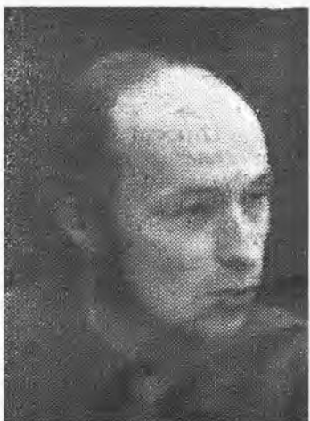
Fotol R. Vihvelin.

24. aprillil seati valimisringkonnas nr. 130 Oktoobri rajooni kandidaadiks KÜ-41 üliõpilane AET KALA . Ta on sündinud 17. VII 1967. ÜLKNÜ liige.