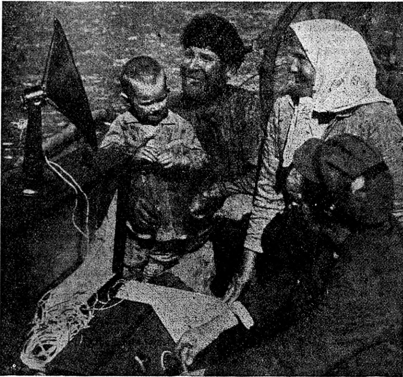
Vene talupojad Volga jõearikul ringhäälingut kuulamas

Ülevenemaaline raadiokomitee Moskvast avaldas hiljuti rea iseloomustavaid andmeid ringhäälingu arengu kohta Nõukogude Venes. Komitee kokkuvõtetel on Venes praegu tegevuses 66 saatjat koguvõimsusega 1617 kilovatti. Vastuvõtuüksusi, nende hulgas abijaamad, ringhäälingu-keskjaamad ja kommunaalsed kuulamiskeskused, komitee arvestab 2.100.000-le. Kaheteistkümne kuu kestel Nõukogude saatjad on olnud tegevuses 11.224 tundi järgmise saatekavajaotusega: ajaviitelise sisuga saateid 6.722 tundi (59,9%), hariduslikke tunde 715,5 tundi (6,4%), informatsiooni ja päevauudiseid 737,3 tundi (6,6%), propagandat 1.114 tundi (9,9%) ja segaeeskavu 1.934,2 tundi (17,2%).