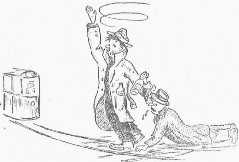
«Если остановка не предусмотрена, то сделаем её непредусмотренной!»

(Из сообщения органов милиции комитету комсомола ТПИ.)