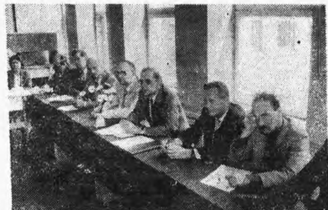
Идет защита на строительном факультете.

— Знаешь, что мне в рецензии написали? «Дипломник заслуживает звания инженера!»