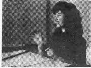
... и миг победы.