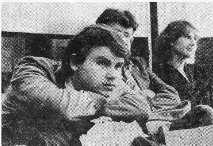
Скоро моя очередь...