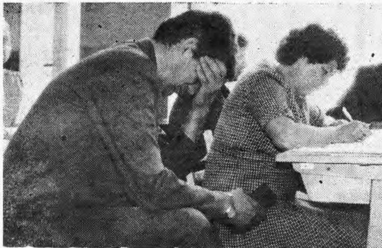
Преподавателям тоже нелегко...