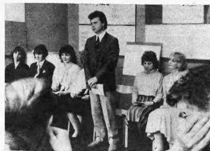
Без пяти минут инженеры.