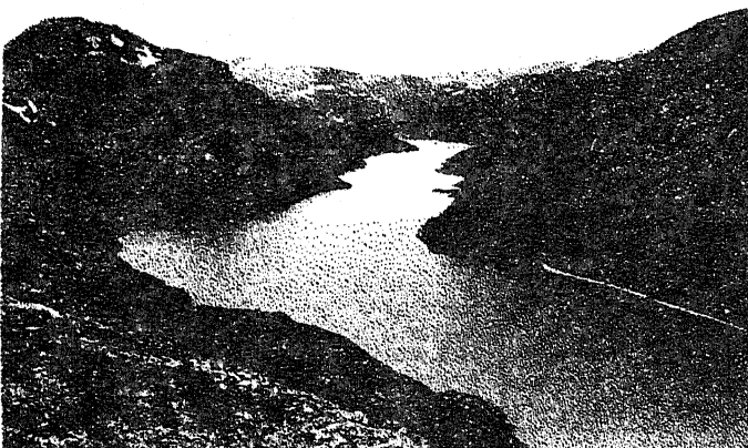
Norra Jotunheimen'i rahvuspark

Noorte reisiklubi pakubki Sulle odavaid reise. Sõita võib tõepoolest igale poole: alates Venemaa mägistest matkadest & lõpetades Hispaania päikesepaisteliste rannikutega. Mil viisil reisida, jääb sinu otsustada. Võid sõita bussi või rongiga, kohapeal seljakotiga matkata, mägedes ronida, suusatada või hobusega ratsa sõita. Tingimused võivad olla küll askeetlikud, kuid Sa oled ju noor – millal siis veel ebamugavusi taluda?