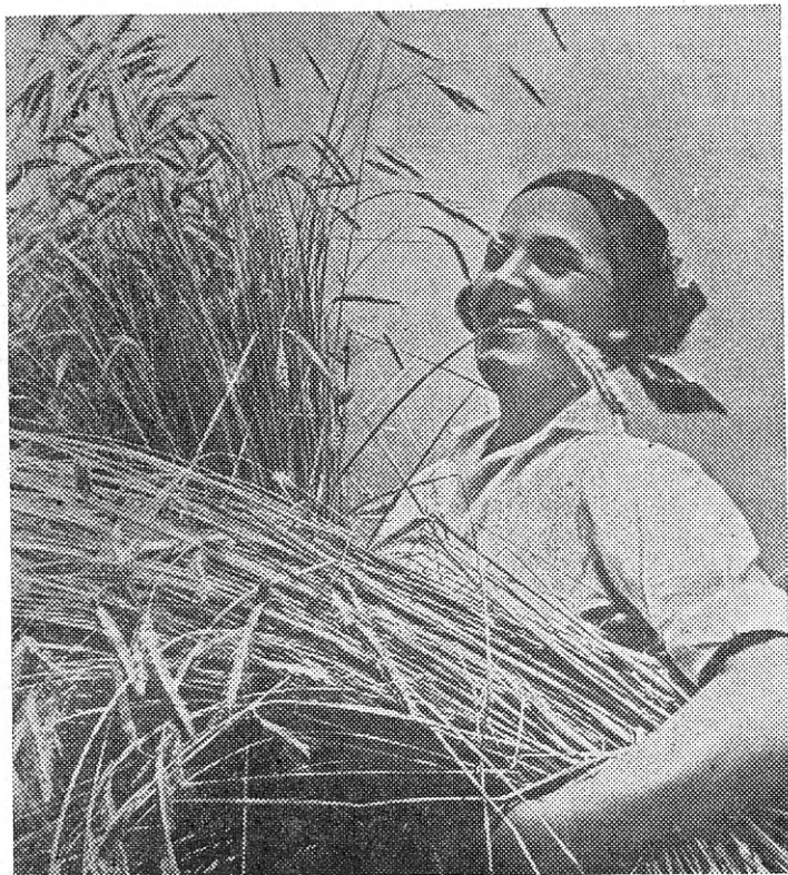
Lõikuseaeg on käes