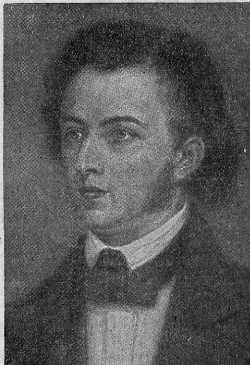
Kuulus poola helilooja ja klaverivirtuoos Friedrich Chopin,

Sisuliselt omab Chopini muusika programmilise iseloomu. Mõnedes töödes, nagu noktüürnid, prelüüdid, impromptud — kõneleb ta meile intiimse elu momentidest; teistes töödes — masurkad, valsid — kujutab ta stseene seltskonna elust (väikesed draamad armastuse tagaplaanil) või igapäevasest rahvaelust. Mõnedel tema töödel on jutustav iseloom — illustreerivad kirjandus-